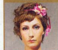
Carice van Houten